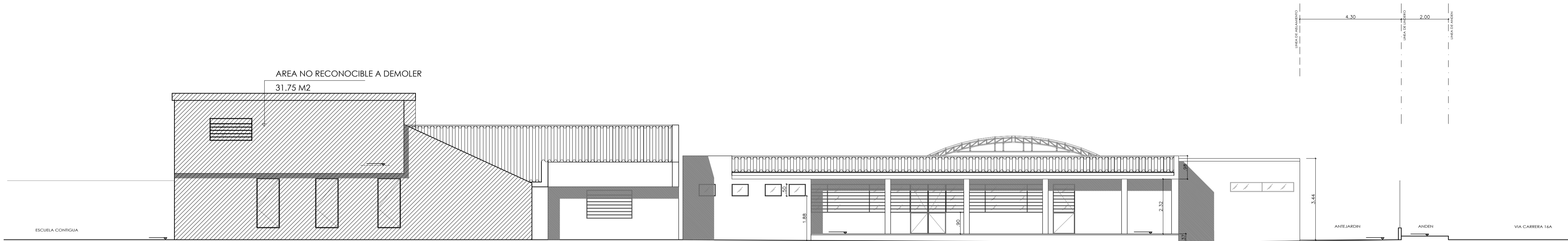
Fachada Interior - Calle 33F Escala 1:100