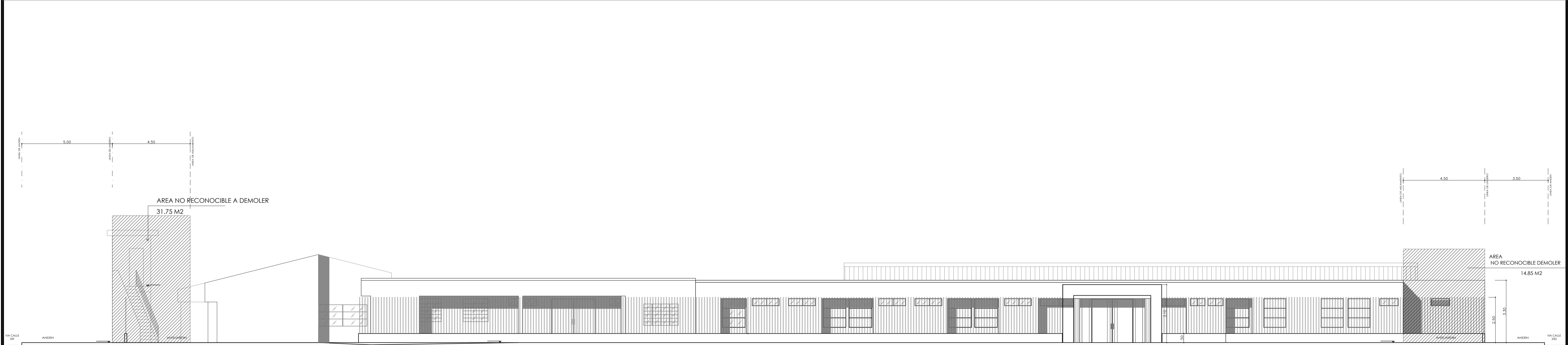
Fachada Exterior - Carrera 16 A Escala 1:100