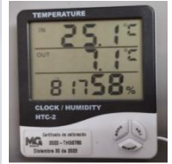
Temperatura de conservación, +2°C y +8°C