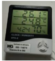
Humedad relativa ambiental 70°C